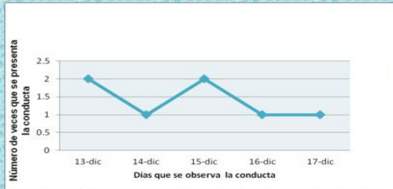
GRÁFICO LÍNEA BASE DESPUÉS DE LA INTERVENCIÓN